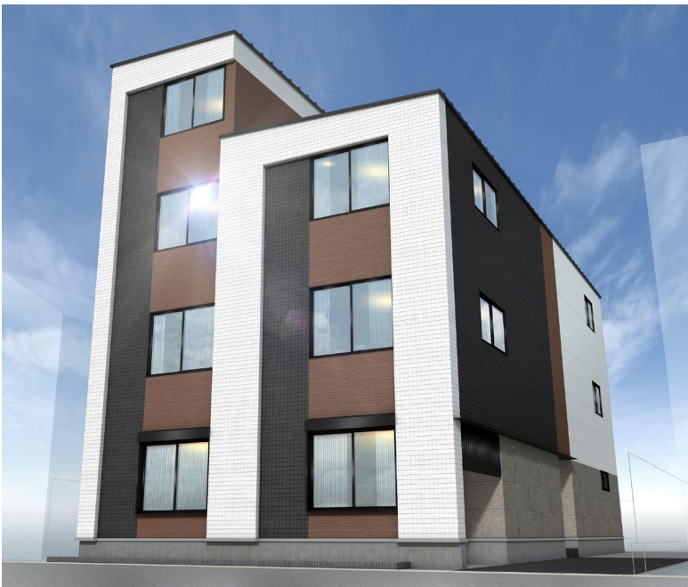
▲(仮称)ルネコート大鳥居V外観イメージ

※2 BEI値とは、エネルギー消費性能計算プログラムに基づく、基準建築物と比較した時の設計建築物の一次エネルギー消費量の比率のこと