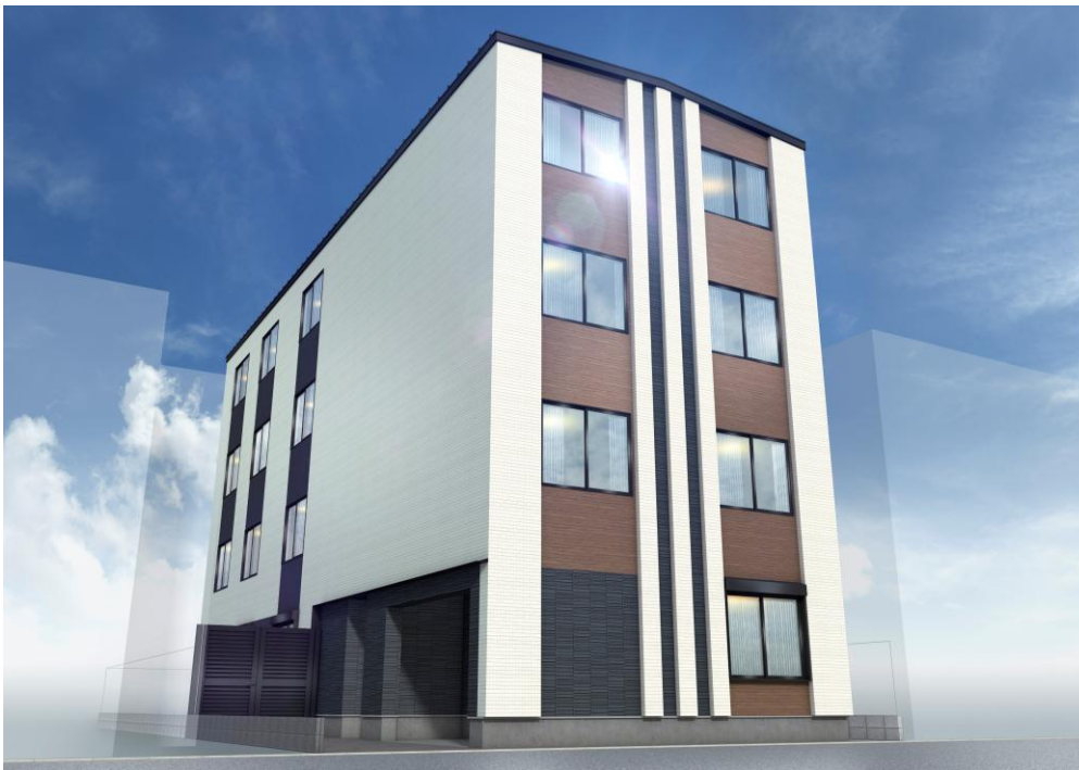
▲ルネコート西大井外観イメージ

※2 BEI値とは、エネルギー消費性能計算プログラムに基づく、基準建築物と比較した時の設計建築物の一次エネルギー消費量の比率のこと