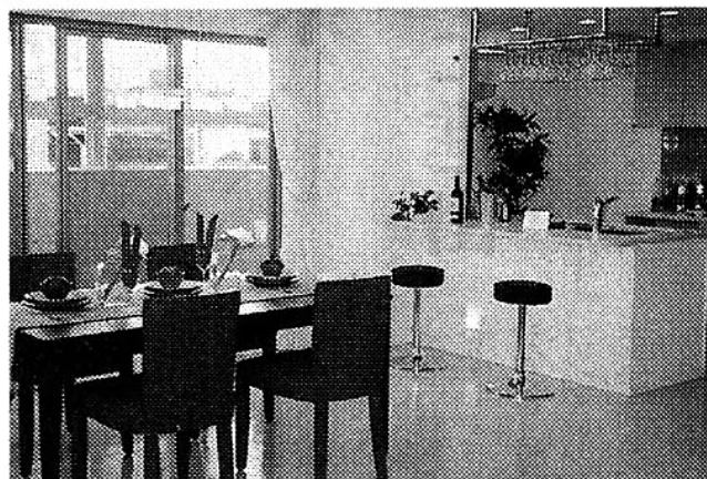
モデルルームのリビング・ダイニング

敷地面積は約2088平方坪、地上15階・地下1階建て。総戸数58戸。間取りは3〜4LDKで、専有面積は約66〜76平方坪。駐車場は敷地内